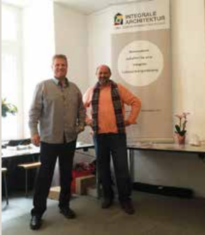
„Besser Leben“ Festival